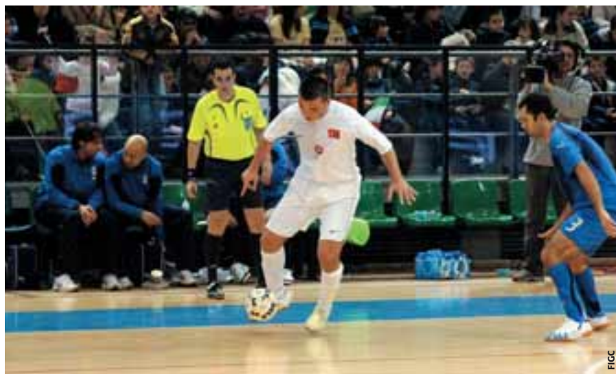
La création d'une équipe nationale a stimulé le futsal en Turquie.

Le temps est donc venu de consentir davantage d'efforts pour les programmes des juniors et du futsal de base. Le futsal est quelque chose qui mérite d'être développé et qui mérite les efforts que nous faisons à cette fin. Il est digne d'intérêt. Il mérite qu'on s'y dévoue. Beaucoup de choses peuvent changer dans votre vie mais vous devez toujours vous souvenir de vos amours. J'aimerais simplement dire que le futsal a été ma femme fatale et qu'il continuera à l'être.