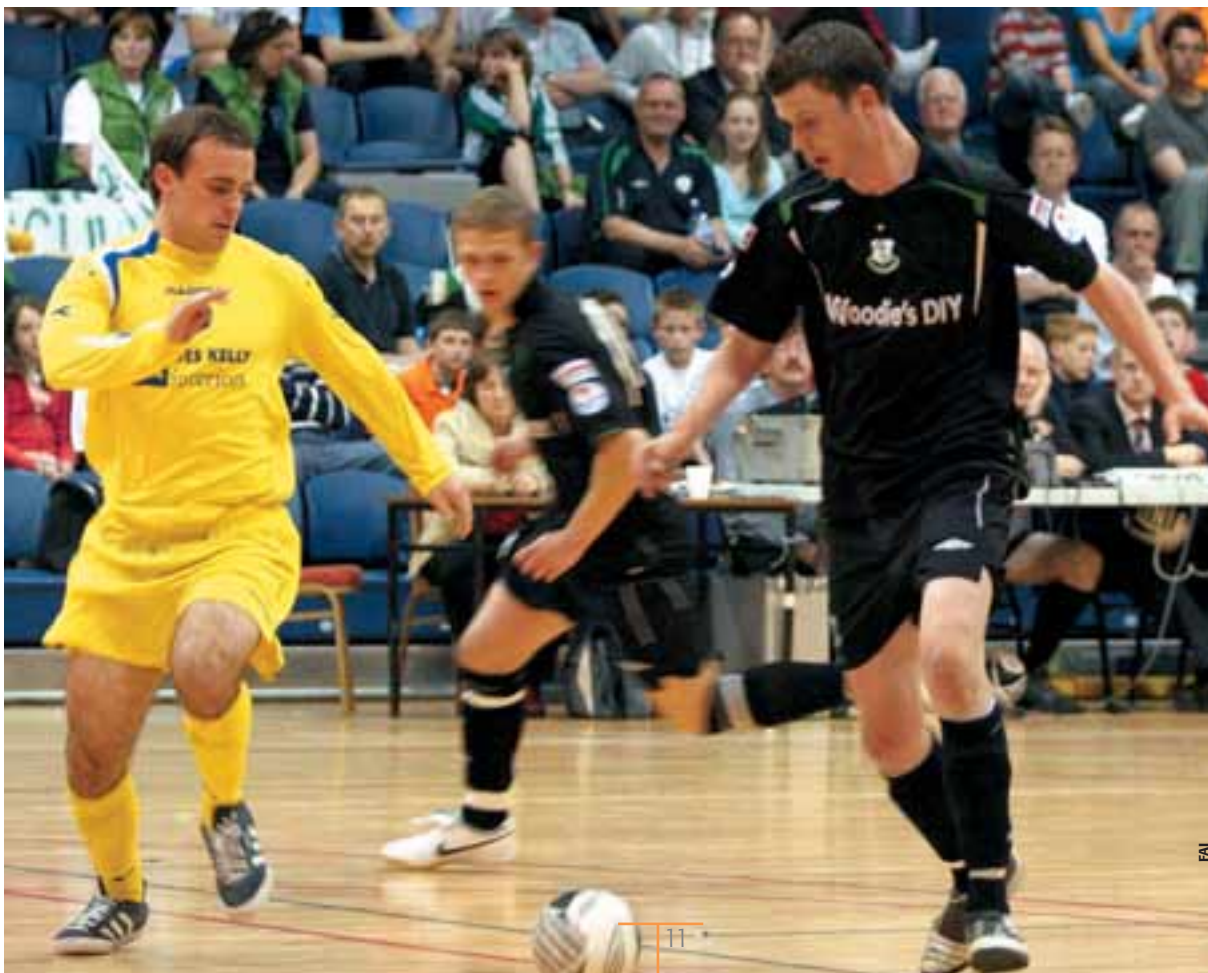
La première édition de la ligue de futsal de République d'Irlande a été un succès.

En même temps, le futsal a été intégré dans des projets destinés aux quartiers déshérités de Dublin; une compétition réunissant 50 équipes et destinée aux moins de 13 ans a été organisée dans la capitale l'an dernier. Et des partenariats ont été conclus aux niveaux de la communauté, de l'école, du collège et des autorités locales. «Nous avons beaucoup fait en 15 mois!, a admis Derek. Mais le côté agréable, c'est qu'il y a encore beaucoup, beaucoup plus à faire.»